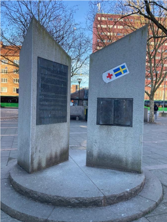
Bilder på minnesmonumentet över Vita bussarna på Värnhemstorget i Malmö